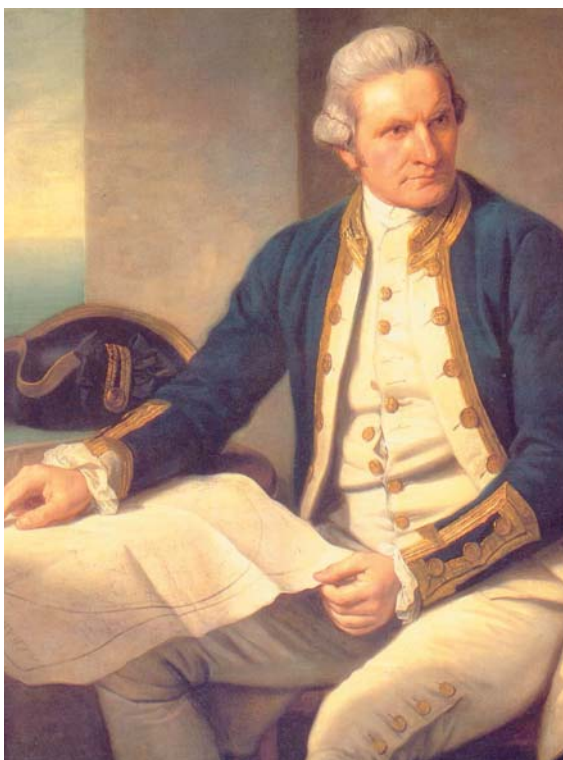
Cuadro. James Cook antes de viajar por el Pacífico

■ 1775. Tercer viaje. El famoso capitán salió de Plymouth en 1775, pero nunca regresó. Murió en 1779 en Hawaii, atacado a puñaladas por nativos.