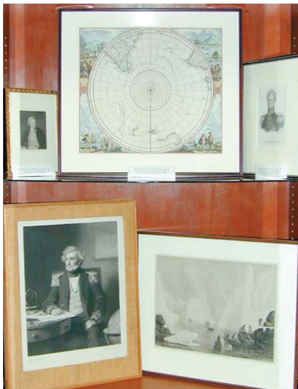
Recuerdos. Los viajes de Cook originaron muchas historias