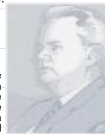
El Presidente Serbio Slobodan Milosevic fue acusado de crímenes contra la Humanidad

Según este plan Serbia se pliega a las exigencias y acepta la entrada en su territorio de fuerzas de la OTAN y rusas. En Kosovo, además, hay una presencia en misión civil de la ONU.