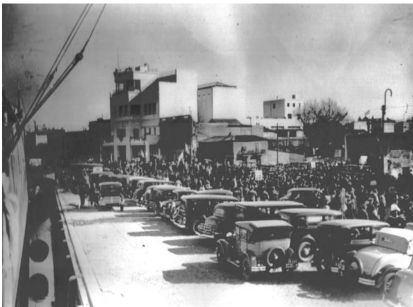
La escuela se inaugura mientras los automóviles esperan a los dueños. 19-07-1936

Automóviles lujosos de los años treinta, con capotas cuadradas y cortinas desmontables, estacionan paralelamente al Riachuelo ¡quieto como nunca! para no entorpecer el espectáculo. La muchedumbre (integrada por autoridades del Ministerio de Educación, la intendencia de Buenos Aires, la institución “Amigos de La Boca y la Isla Maciel” y, los vecinos) canta emocionada el Himno Nacional Argentino. El local está colmado. El palco de las autoridades congrega a personajes importantes de la cultura y la política.