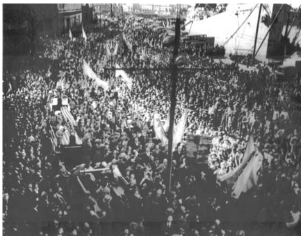
La muchedumbre en la Avenida Pedro de Mendoza, frente a la escuela que mira al Riachuelo de La Boca. Bs. As. 19-07-1936.