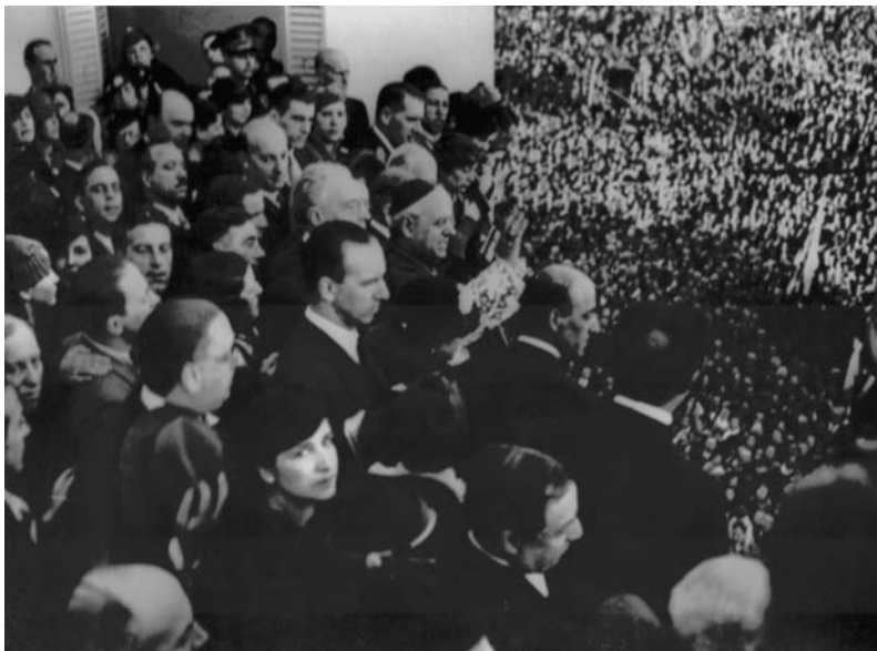
Desde los balcones de la Escuela Museo, el Cardenal Copello bendice las instalaciones, de cara a la multitud, que presencia el acto educativo cultural. Bs. As., 19-07-1936

El cielo es más azul entre los barcos sembrados de banderas argentinas. Los inmigrantes aflojan una lágrima. El Riachuelo –manantial del pintor– glaseado de mansedumbre en la superficie, siente hervir las aguas de su cauce. Esa mañana de julio, el artista se confabula con el río y lo saluda con una reverencia por la conquista cultural que sacude sus vísceras.