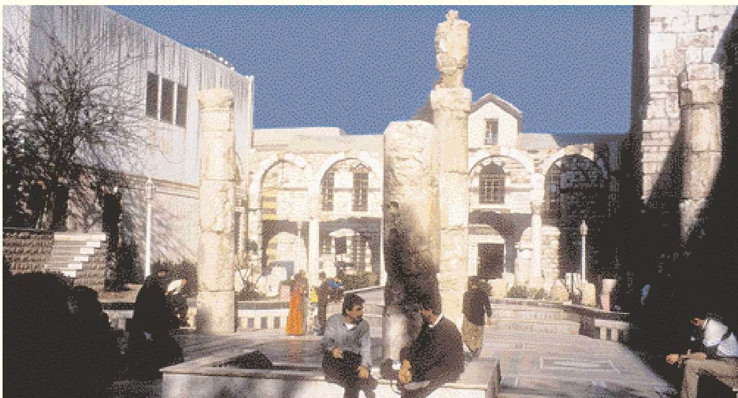
Ruinas romanas cerca de la Mezquita Omeya

Construida la mezquita sobre emplazamientos sagrados, representa la historia de la humanidad, pues en sus muros se mezclan tres religiones, tres civilizaciones y cuatro etapas de la historia del hombre.