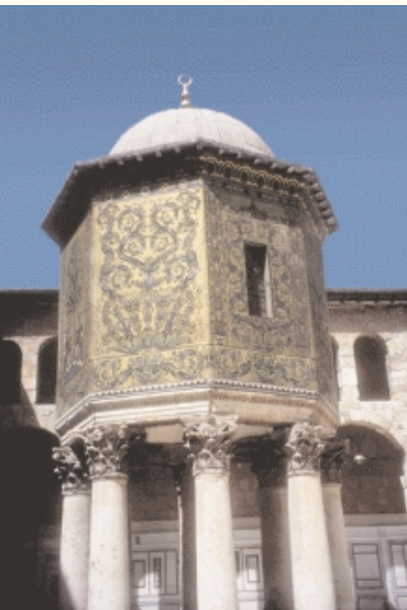
Tesorería de la Mezquita Omeya