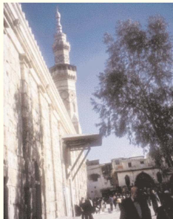
Minarete de la Mezquita Omeya منارة الجامع الأموي

En primer lugar están los hoteles de la cadena 'Cham Palaces and Hotels', que se encuentran en la mayoría de las regiones de Siria. En Damasco hay dos hoteles de esta cadena, uno de ellos en el centro de la ciudad. Es un hotel lujoso y cómodo, con los interiores decorados con marquetería. Incluso la entrada parece que le va a llevar al mundo de las mil y una noches. ■