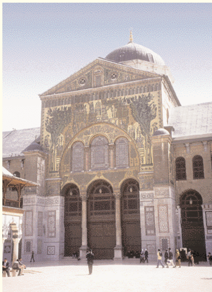
Tesorería de la Mezquita Omeya بيت المال في الجامع الأموي

tendencia. Es un lugar para la oración, el reposo y las citas. Los no musulmanes pueden visitar algunas partes e incluso toda la mezquita, excepto el recinto sagrado los viernes. Los visitantes pagan una entrada, tienen que quitarse los zapatos y a las mujeres se les dan chales para cubrirse la cabeza.