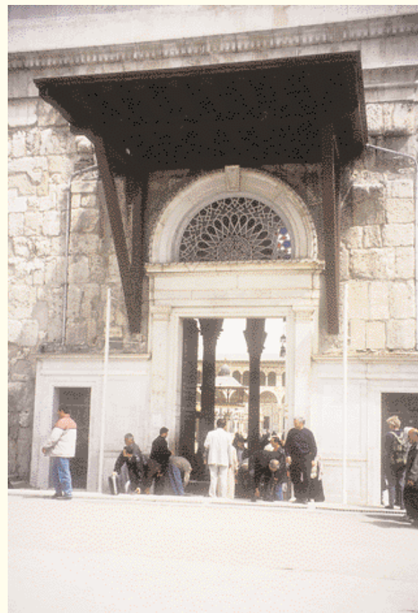
Entrada a la Mezquita Omeya

El oratorio tiene 135 metros de largo y 37 de ancho. Es el centro palpitante de la mezquita, coronado por una cúpula fantástica que domina el patio. Se trata de un espacio con tres galerías interiores, cada una de ellas con una doble fila de